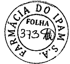
TABELA DE REAJUSTE